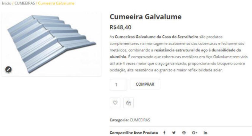
Figura 4: https://casaserralheiro.com.br/product/cumeeira-galvalume/ , acesso em 19/11/2021.